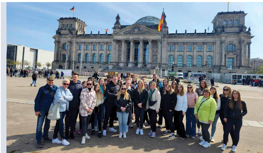
Studenci podczas cyklicznej wizyty studyjnej w Berlinie