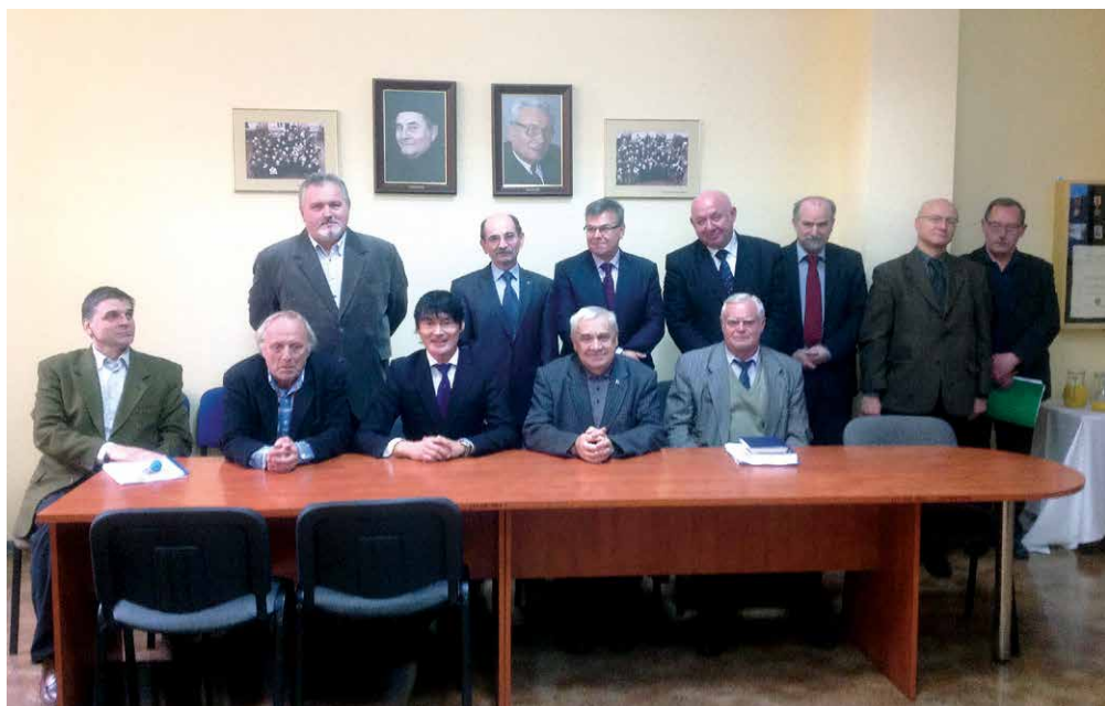
Członkowie Rady Naukowej Instytutu Politologii i Europeistyki