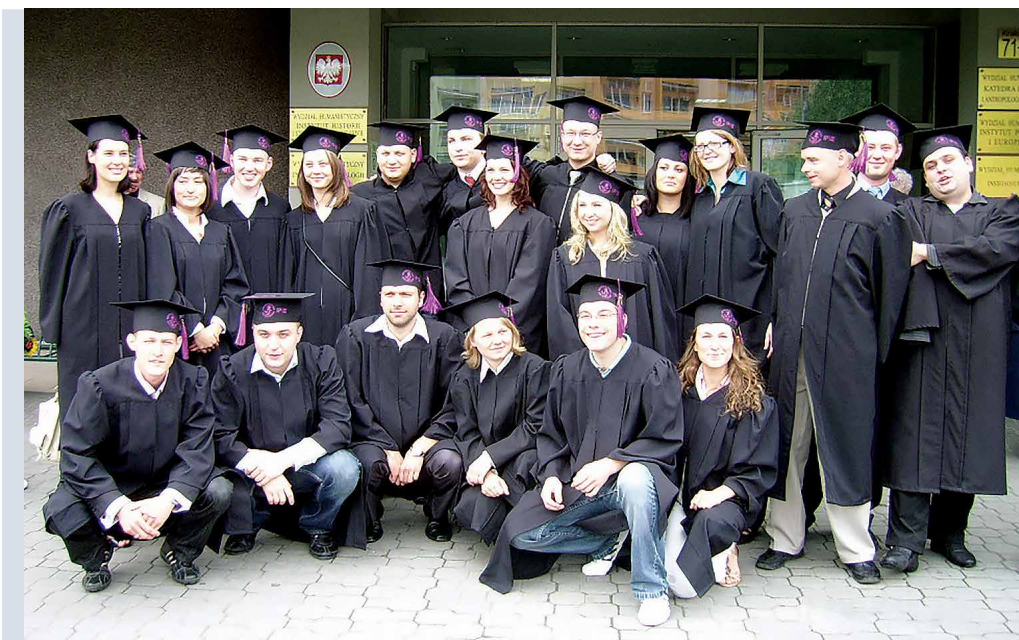
Absolwenci studiów na kierunku politologia (2009)