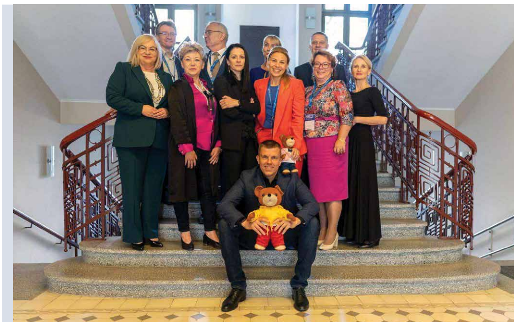
Zarząd PTNP po podjęciu decyzji o wybraniu INoPIB na organizatora Ogólnopolskiego Kongresu Politologii (2024)