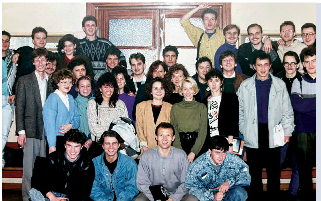
Studenci kierunku politologia (1990)