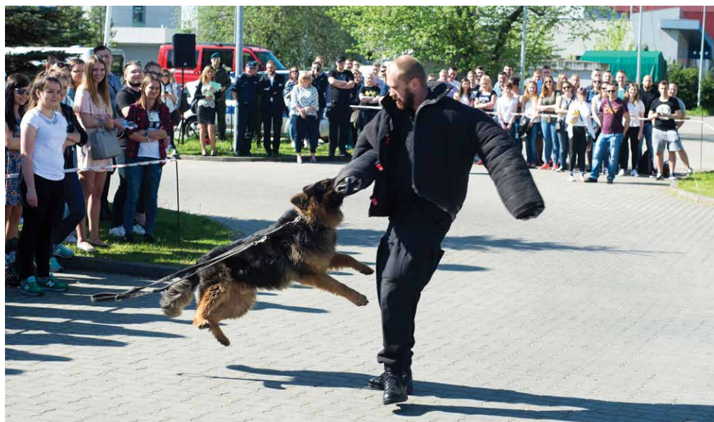
II Forum Bezpieczeństwa