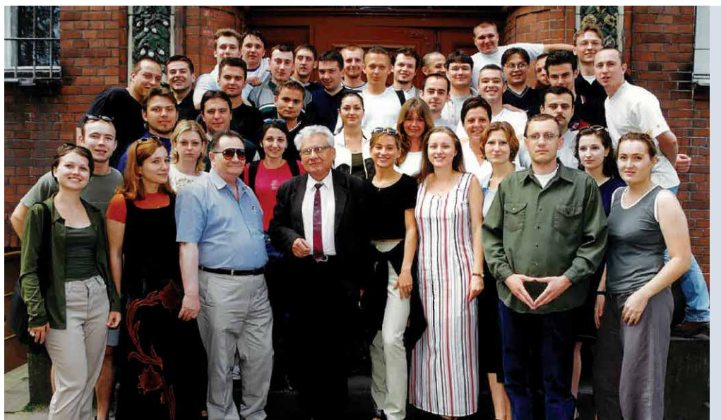
Studenci kierunku politologia (1997)