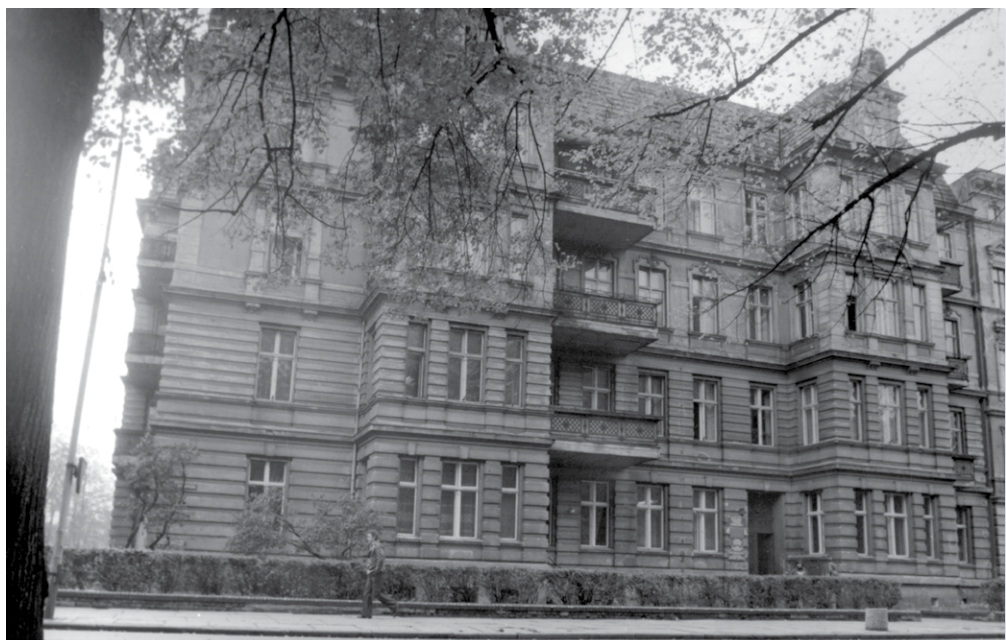
Dawna siedziba Instytutu przy ówczesnej alei Jedności Narodowej (dziś aleja Jana Pawła II)