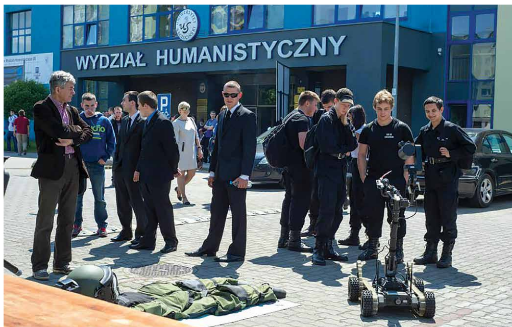
I Forum Bezpieczeństwa