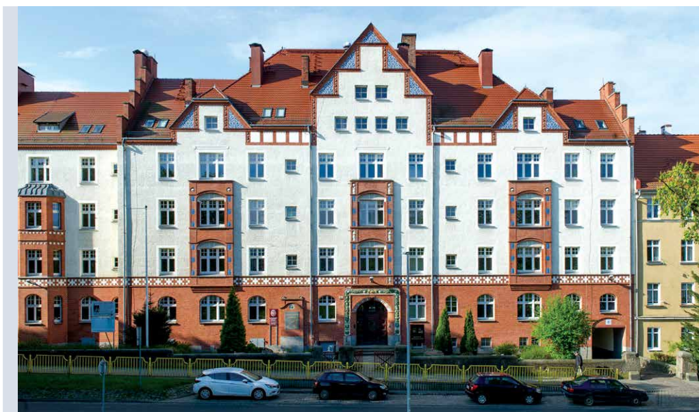
Dawna siedziba Instytutu przy ul. Mickiewicza