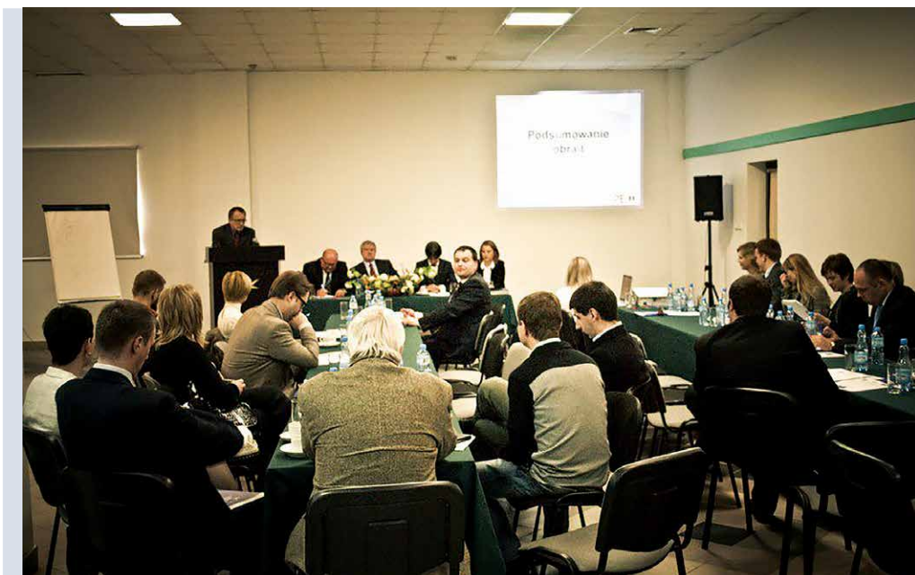
Konferencja naukowa w Międzyzdrojach (2011)