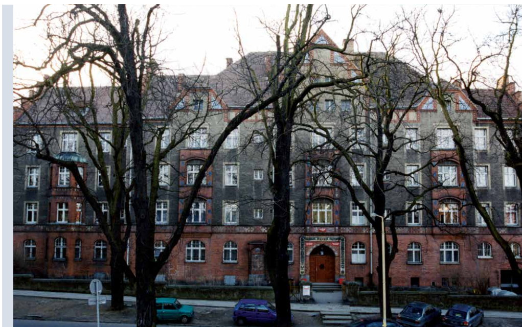
Dawna siedziba Instytutu przy ul. Mickiewicza