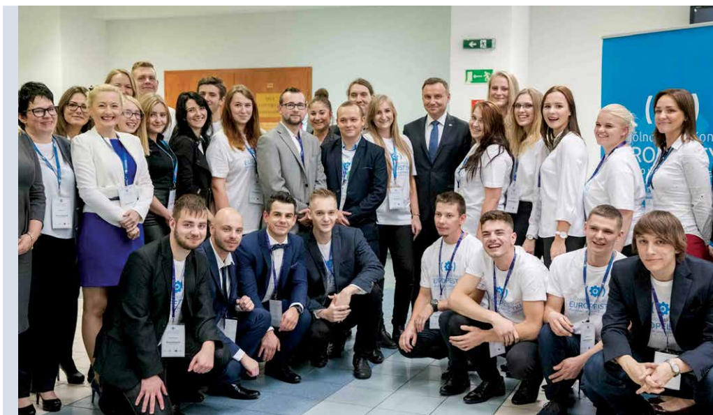
Organizatorzy II Ogólnopolskiego Kongresu Europeistyki w Szczecinie (2017) z prezydentem Andrzejem Dudą