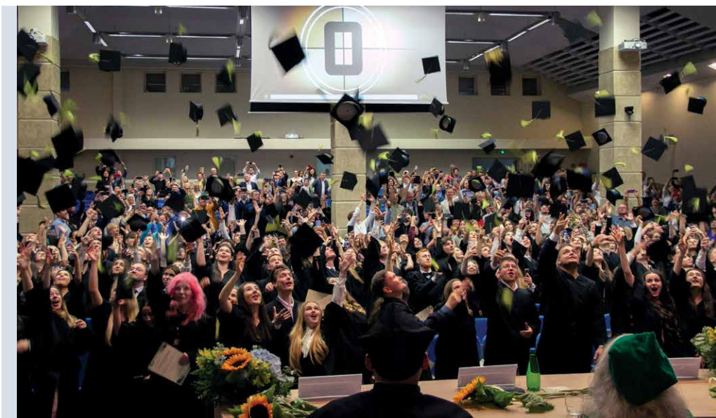
Absolutorium studentów Instytutu Nauk o Polityce i Bezpieczeństwie US (2025)