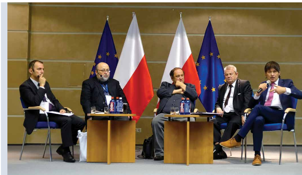
Debata podczas II Ogólnopolskiego Kongresu Europeistyki w Szczecinie (2017)