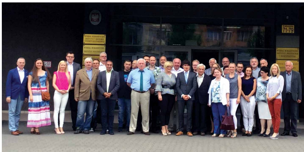
Pracownicy Instytutu przed siedzibą przy ul. Krakowskiej