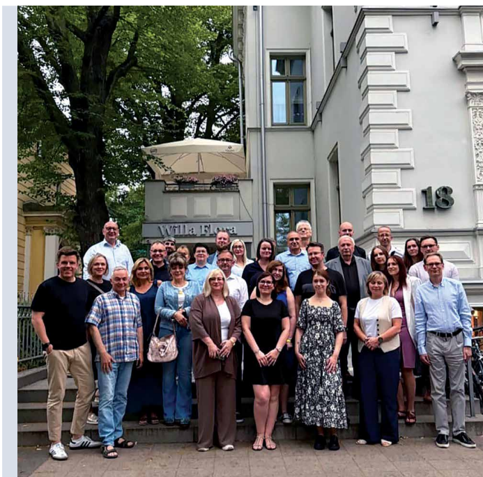
Pracownicy Instytutu podczas spotkania integracyjnego (2025)