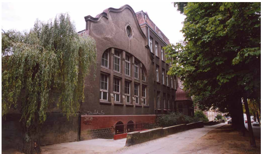
Dawna siedziba Instytutu przy ul. Mickiewicza