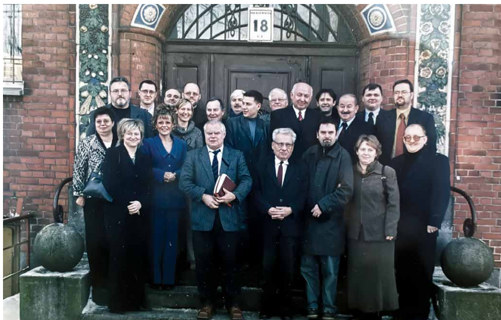
Pracownicy Instytutu przed siedzibą przy ul. Mickiewicza