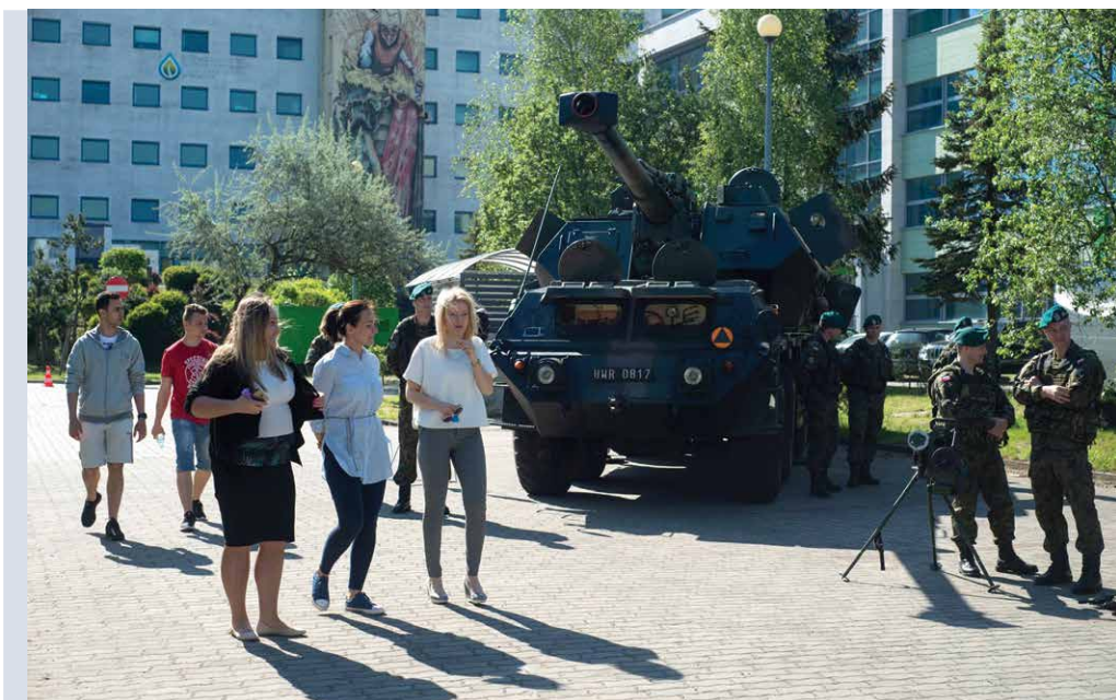
II Forum Bezpieczeństwa